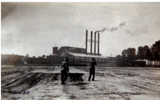
L'usine frigorifique du GISD.

En partenariat avec la commune de Gièvres et l'association Gièvres Souvenirs Patrimoine et Culture.