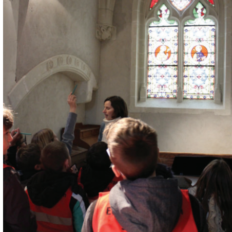
À la découverte de la chapelle seigneuriale de l'église de Fougères-sur-Bièvre.