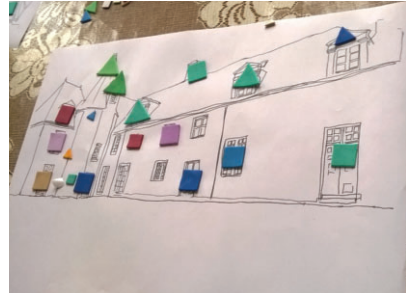
Le Conte de Mareuil.