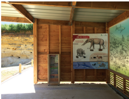
Un des aménagements pédagogiques de la carrière du Four à Chaux.