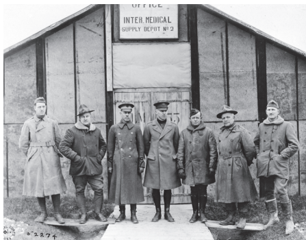
Gièvres. GISD. Officiers devant un bureau d'infirmierie (AEF Signal Corps. NARA. Collection Musée de Sologne).