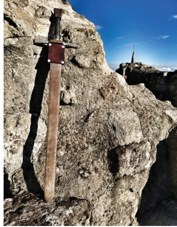
L'épée du seigneur à retrouver.