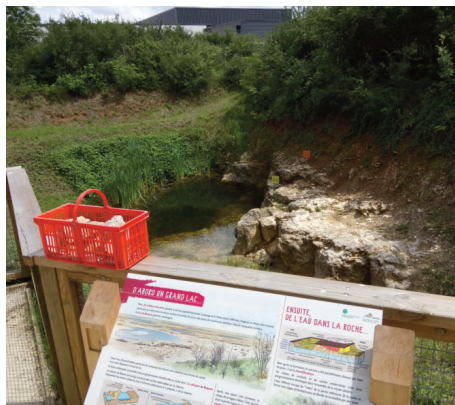
Vue sur le front de taille de la carrière du Haut-de-la-Plaine-Saint-Gilles.

Enjeu éducatif : relier les ressources naturelles résultant de l'activité de la planète et leur exploitation par les êtres humains pour leurs besoins.