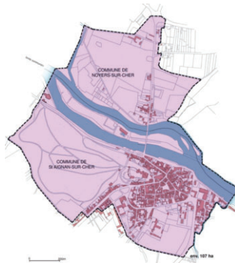
Le périmètre du futur Site Patrimonial Remarquable (SPR) de Saint-Aignan et Noyers-sur-Cher

Niveau : Collège-lycée Durée : 1 séance de 2h Capacité : classe entière GRATUIT