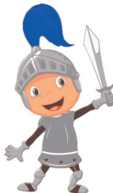
Le chevalier Thomas.