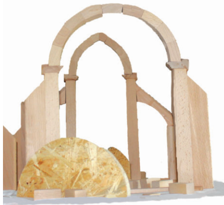
Les maquettes d'arcs brisé et plein-cintre.